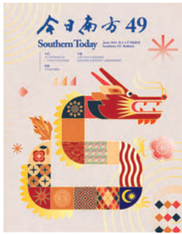
封面设计 / 朱丽仪