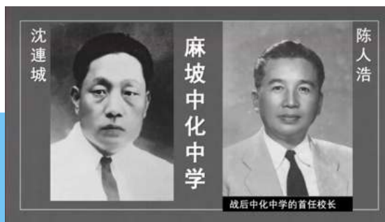
战后中化中学的首任校长