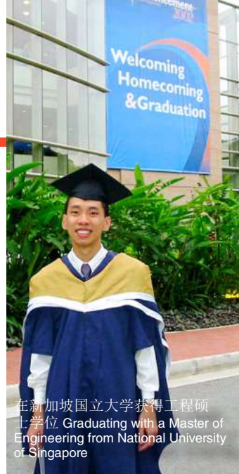
在新加坡国立大学获得工程硕士学位 Graduating with a Master of Engineering from National University of Singapore

我的视角。我看到了教育的变革潜力——它不仅能够培养年轻的心智，促进批判性思维技能，还能灌输终身热爱学习的精神。