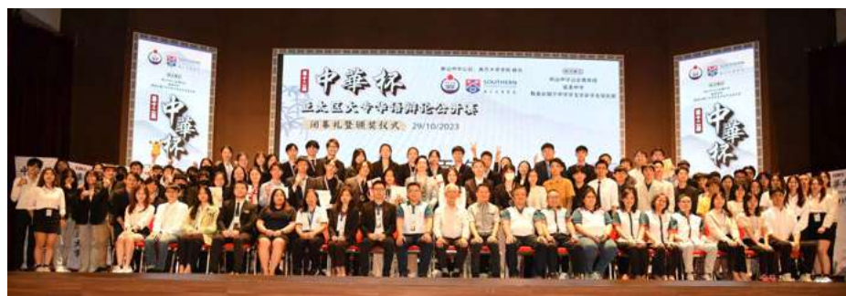
第十二届中华杯亚太区华语辩论赛闭幕仪式合影。

这一盛会不仅是一场辩论比赛，更是一次文化交流和学术碰撞的盛宴。让各参赛院校的辩手们在比赛中施展才华，展示风采，共同见证中华杯亚太区华语辩论赛的成功举办。