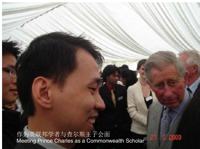
作为英联邦学者与查尔斯王子会面 Meeting Prince Charles as a Commonwealth Scholar