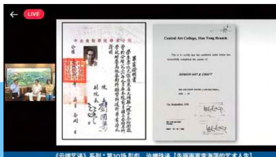
《云端艺谈》系列* 第30场 彭彪、许媛珠谈【先驱画家李海萍的艺术人生】