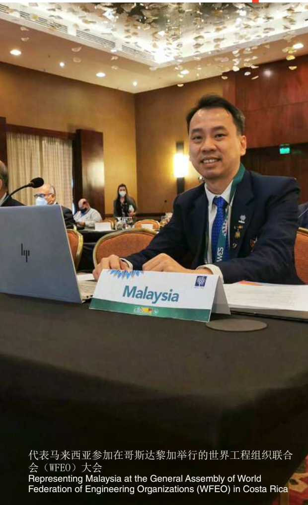
代表马来西亚参加在哥斯达黎加举行的世界工程组织联合会 (WFEO) 大会 Representing Malaysia at the General Assembly of World Federation of Engineering Organizations (WFEO) in Costa Rica

And yet, amidst the excitement and exhilaration of the engineering world, I felt a calling – a calling to inspire and empower future generations with the knowledge, skills, and confidence they need to navigate an increasingly complex world. It was a calling that led me to transition into the realm of education, where I found a new avenue for channelling my passion for growth and discovery.