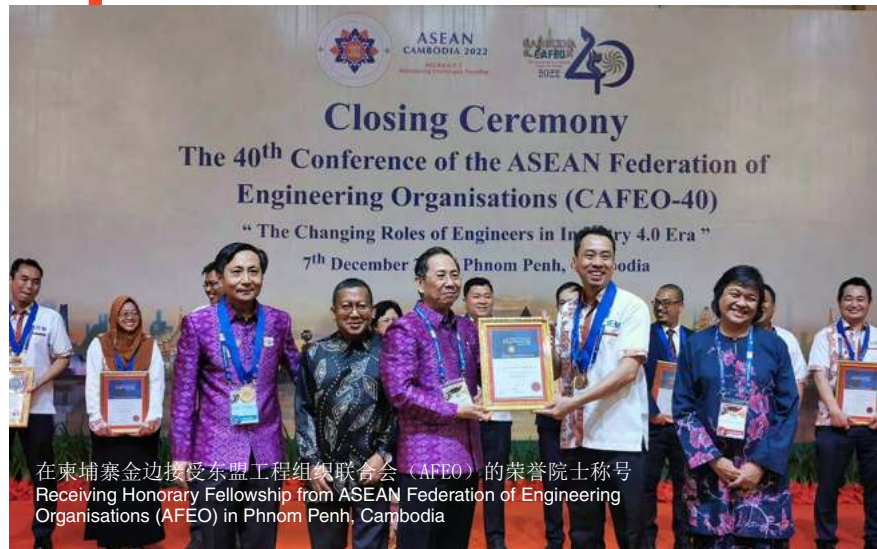
在柬埔寨金边接受东盟工程组织联合会（AFEO）的荣誉院士称号 Receiving Honorary Fellowship from ASEAN Federation of Engineering Organisations (AFEO) in Phnom Penh, Cambodia

As members of this vibrant university community encompassing boards, administrators, academic staff, students, and alumni, we are integrated and united by a common mission, i.e. to create a home of academic excellence and cultural enrichment, nurturing global citizens with ethics, wisdom and passion. It is a mission that transcends disciplines and boundaries, and it is a mission that guides us in everything we do.