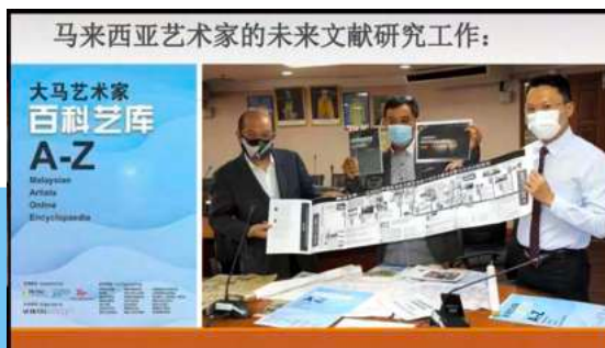
马来西亚艺术家的未来文献研究工作:

大马艺术家 百科智库 A-Z Malaysian Artists Online Encyclopedia