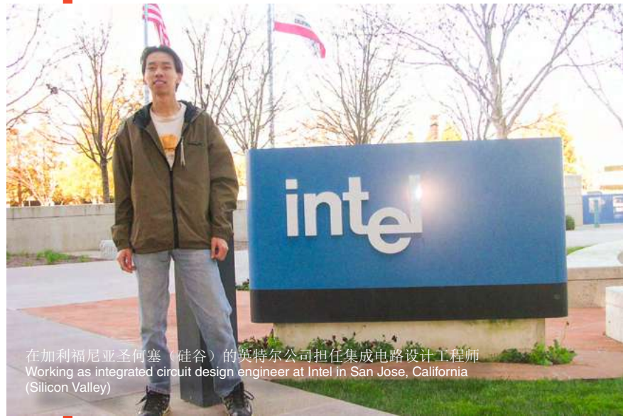
在加利福尼亚圣何塞（硅谷）的英特尔公司担任集成电路设计工程师 Working as integrated circuit design engineer at Intel in San Jose, California (Silicon Valley)

Today, being the captain of Southern University College, I am constantly reminded of the incredible journey that has led me to this moment. It is a journey defined by resilience, perseverance, and a steadfast commitment to the pursuit of excellence. And it is a journey that I am deeply grateful to share with each and every one of you.