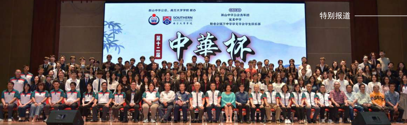
第十二届中华杯亚太区华语辩论赛开幕仪式合影。