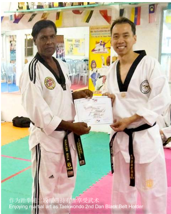
作为跆拳道二段黑带持有者享受武术 Enjoying martial art as Taekwondo 2nd Dan Black Belt Holder