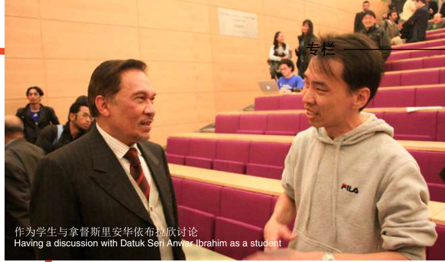
作为学生与拿督斯里安华依布拉欣讨论 Having a discussion with Datuk Seri Anwar Ibrahim as a student

As I made the leap from engineer to educator, I encountered new challenges and opportunities that tested my resolve and reshaped my perspective. I discovered the transformative potential of education – of nurturing young minds, fostering critical thinking skills, and instilling a lifelong love of learning.