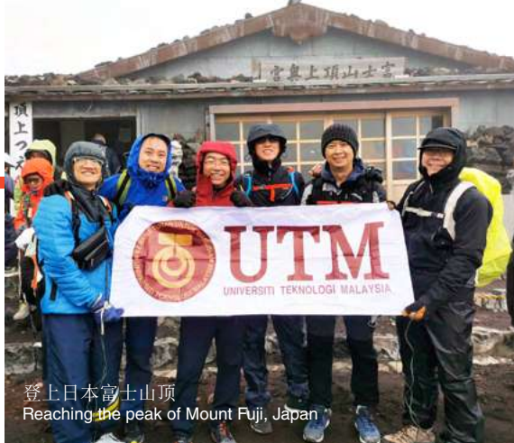
登上日本富士山顶 Reaching the peak of Mount Fuji, Japan

当我回顾从充满活力的工程世界到崇高的教育领域的旅程时，内心充满了深深的感激和谦卑。这是一个充满挑战和胜利的旅程，但最重要的是，它展示了知识和学习的变革力量。