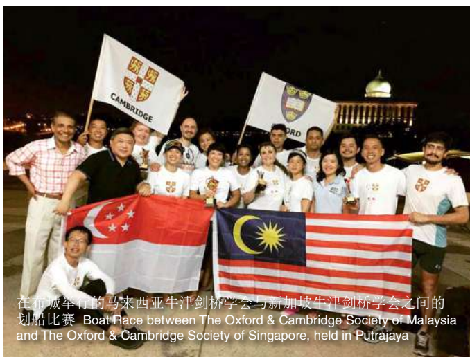
在布城举行的马来西亚牛津剑桥学会与新加坡牛津剑桥学会之间的划船比赛 Boat Race between The Oxford & Cambridge Society of Malaysia and The Oxford & Cambridge Society of Singapore, held in Putrajaya